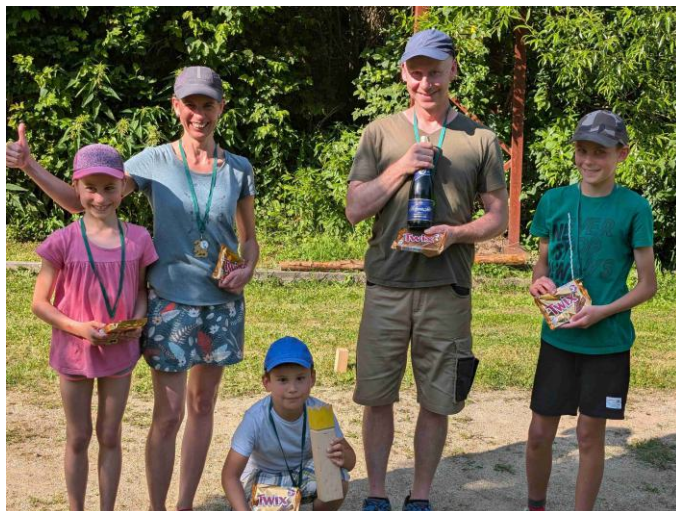
foto: vítězné družstvo Green team

Společně jsme strávili opravdu zábavné odpoledne, proto se těšíme na 1. ročník turnaje v příštím roce. AKA