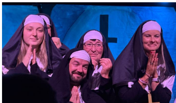
foto zleva: valští účastníci akce, představení Boží show; nahoře pozvánka do Kašavy