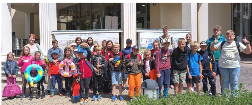
foto zleva: děti připravující se na výlet, společné foto před Aquaforem, malovaná trika - výrobky dětí

Máte námět na článek, který by mohl zajímat i ostatní? Pořídili jste ve Valech zajímavou fotografii?