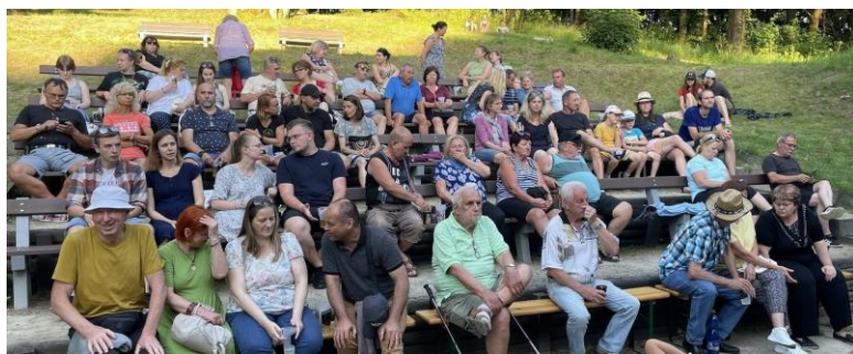
foto: pohled do publika