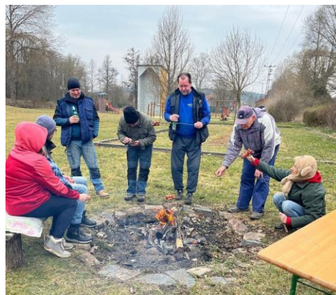
foto: dobrovolníci, odpad, zasloužená odměna