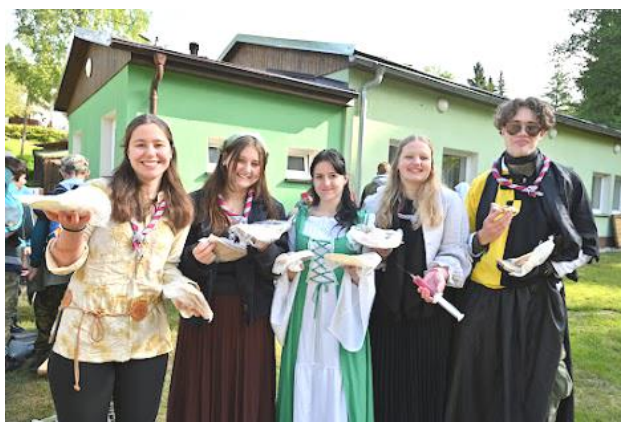
foto: stanoviště u Bažantnice a u Klubovny ve Valech