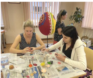
foto shora: děti malující obří kraslice, maminky zdobící barvená vajíčka