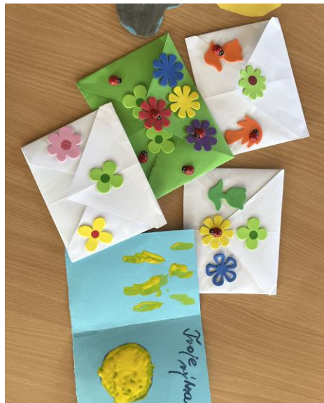
foto: hotové výrobky