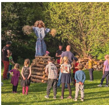
foto zleva: stavění májky, zapálení čarodějnice, stojící májka v podvečer