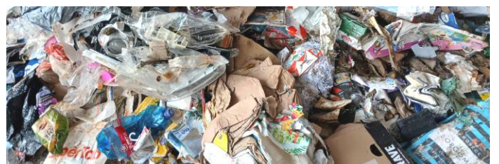
foto: odpad vytríděný jako papír obsahující plasty, kovy a zbytky jídla