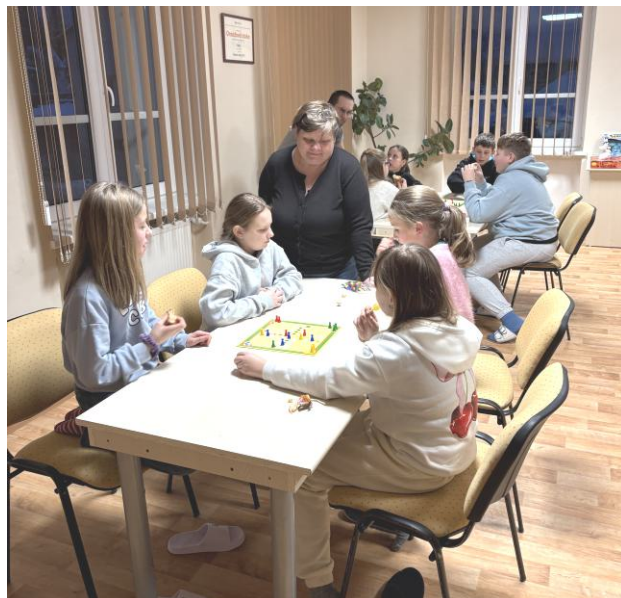
foto: účastníci akce při hře