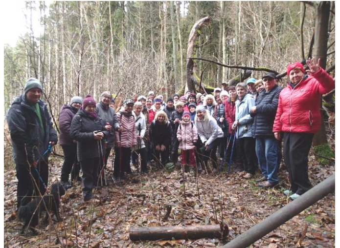
foto: turisté u Krále smrků