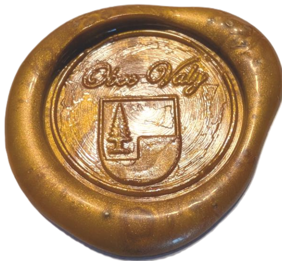
foto: pečeť obce Valy