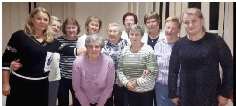
nahoře : kdysi